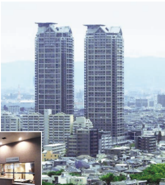
(写真:右側の棟が壱番館さまです)

堺市の玄関口であるJR堺市駅と直結したタワーマンション、ベルマージュ堺壱番館さま。図書館・スポーツ施設・商業施設が一体となった、便利で快適な大型複合施設です。今回は、モニターの映像が見づらい、呼出・通話ができなくなるといった経年劣化による不具合と、録画機能が付いていないというセキュリティ面の不安を理由にリニューアルをお考えのことでした。ご提案したのは「VIXUS 1Pr(ヴィクスワンペア)」と「管理業務システム」。自動録画機能と、見やすい7型ワイドモニターでセキュリティ面が大幅に改善された他、電子回覧板機能で居住者への連絡も簡単になりました。